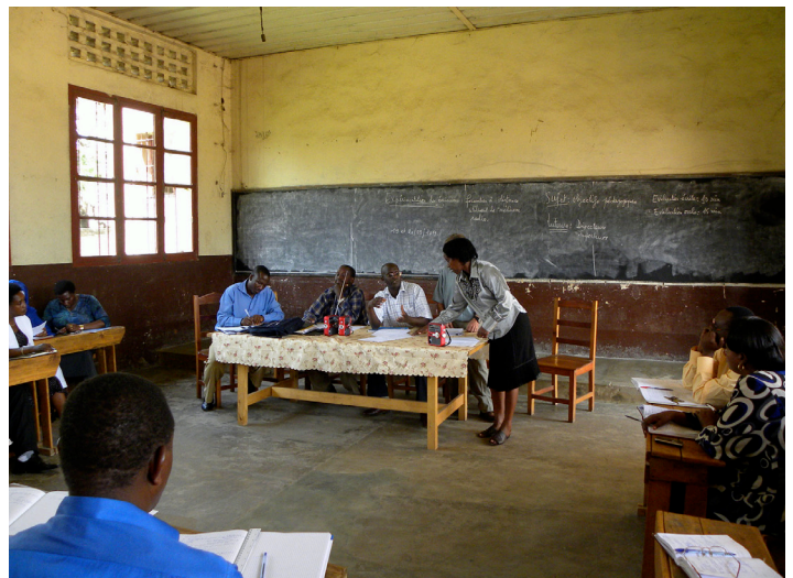
Expérimentation des émissions radiophoniques auprès des directeurs et des inspecteurs, dans une école à Bujumbura-Mairie, en septembre 2011.

Solidement arrimée aux résultats positifs obtenus depuis le début du projet, une dernière mission au Burundi, du 9 au 25 septembre 2011, a permis de compléter la formation, d'évaluer le processus et de faire des recommandations pour assurer un transfert optimal de l'expertise et de pérenniser les compétences de l'équipe burundaise. Ajoutons que ces deux semaines de séjour burundais ont aussi donné lieu à l'organisation et à la tenue d'un colloque sur le développement, à moyen et à long terme, de la formation à distance.