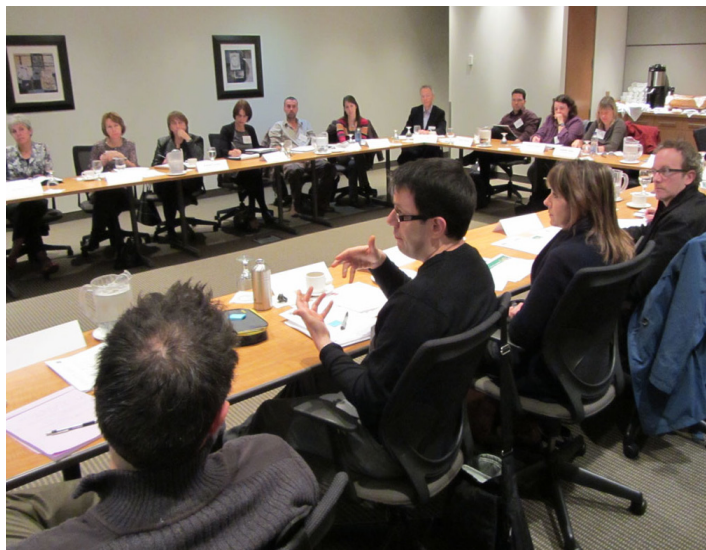
Les participants à la rencontre SOFAD – CS du 2 novembre en train d'échanger informations et points de vue durant le dernier atelier.

En fin de journée, les participants ont fait une évaluation positive à tous égards de l'événement, se réjouissant particulièrement du fait qu'un comité de travail allait être créé dans son prolongement. Une rencontre semblable est souhaitée pour l'an prochain.